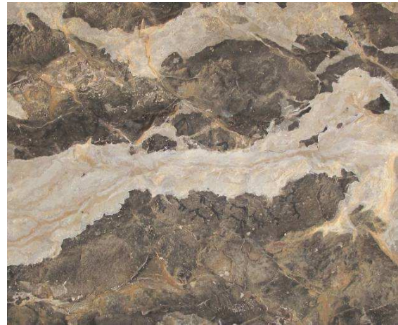
Figura 1. Detalle del panel x-3 decorado con motivos esquemáticos. Fase de documentación fotográfica.