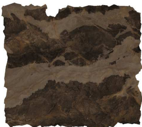
Figura 4. Ortofoto generada a partir del modelo 3D.