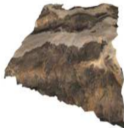
Figura 3. Modelo 3D con las texturas aplicadas