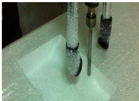
Figura 6. Detalle del proceso de impresión 3D sobre plancha de poliestireno expandido.