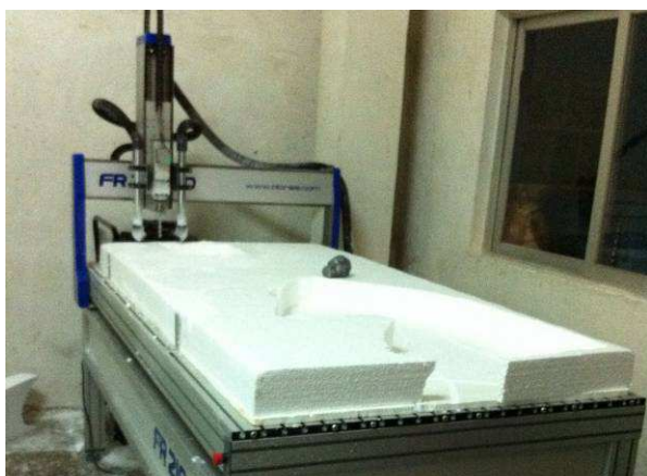
Figura 5. Impresora 3D utilizada durante el proceso de creación de la réplica del panel decorado original.