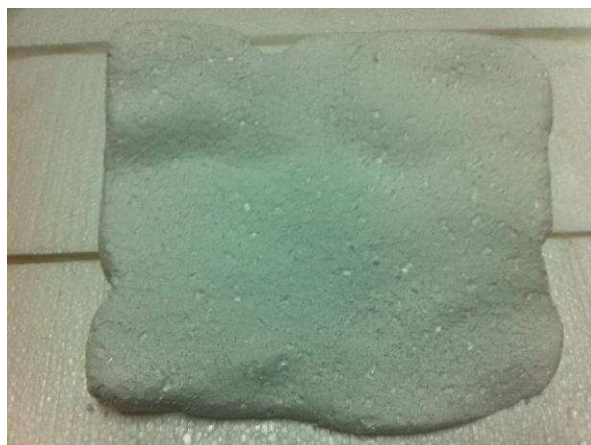
Figura 7. Réplica a escala 1:1 del panel original.