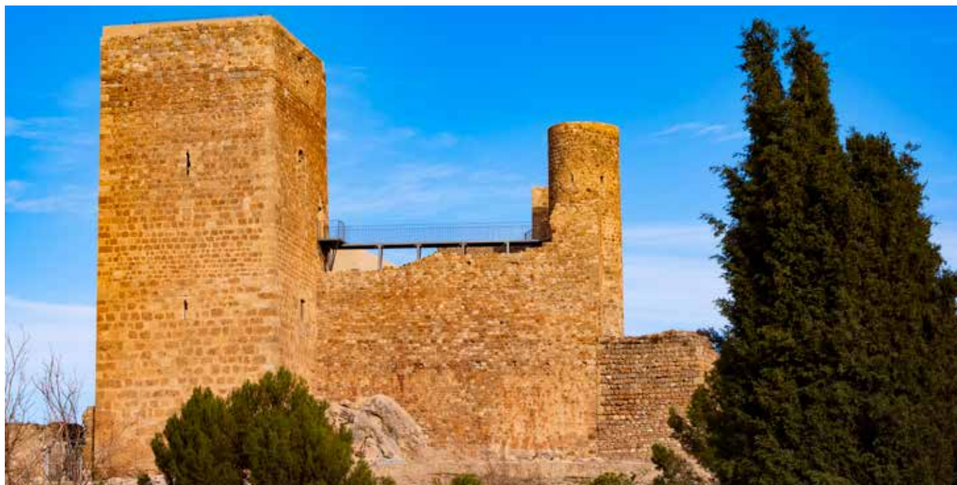
1. Vista oeste del castillo después de su restauración 1. Western view of the castle after its restoration