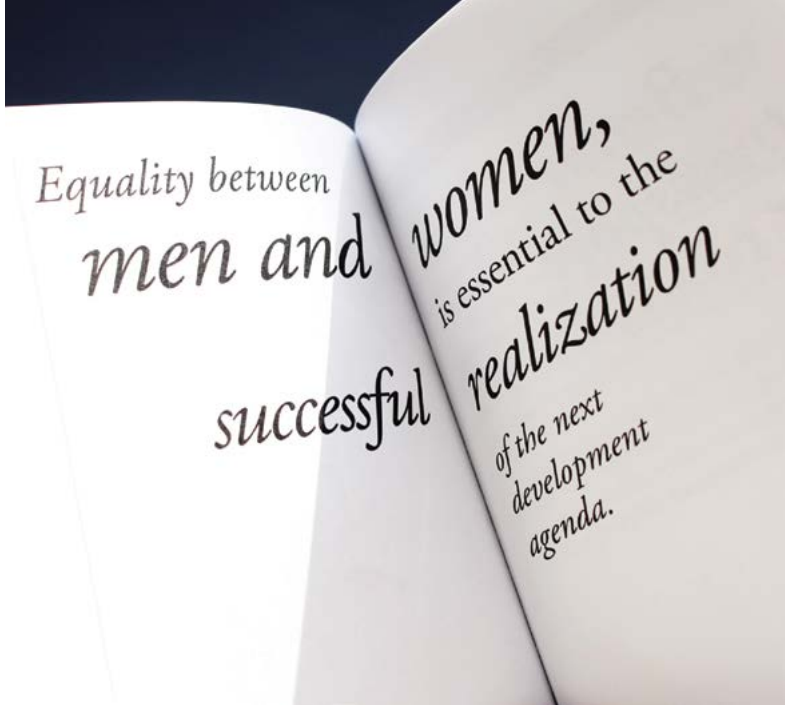
En esta página y la contigua imágenes del proyecto We the peoples .