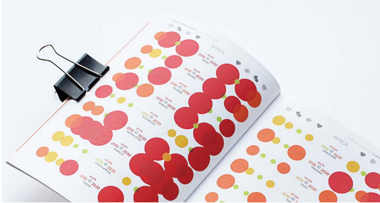
Diseño de informe Climate Vulnerability Monitor y detalle de infografía para Dara.