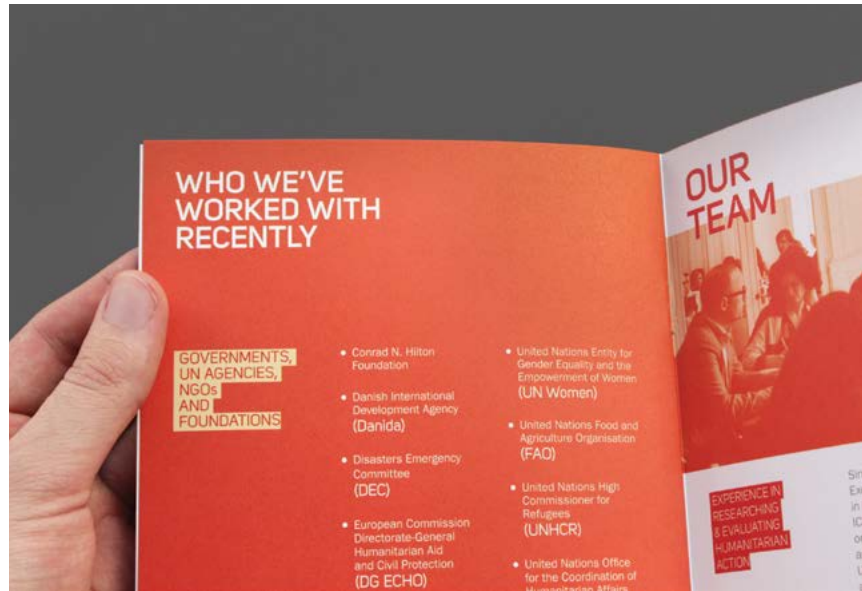
Diseño de identidad corporativa, folletos y memoria para Dara.