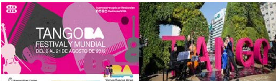
Figura 2. Festival Buenos Aires Tango

El Festival Buenos Aires Tango, tiene su origen en la Ley N° 130 (1998) por lo que la Ciudad Autónoma de Buenos Aires reconoce al tango como parte integrante de su patrimonio cultural. Dicha Ley crea la Fiesta Popular del Tango a realizarse en la ciudad anualmente, la cual debiera culminar coincidiendo con el día 11 de diciembre, Día Nacional del Tango. Siguiendo a Morel (2013:160) puede decirse que esta Fiesta Popular del Tango fue cambiando su denominación, fechas y lugares de realización. Las primeras 3 ediciones se realizaron el 11 de diciembre, luego se traslada a fines de febrero a los fines que coincida con los circuitos turísticos de los carnavales de Río de Janeiro. Finalmente, en su décima edición, se ubica en agosto junto al Campeonato Mundial de Tango de forma tal que coincida con las vacaciones de invierno de países europeos. Las actividades van desde charlas, obras de teatro, clases abiertas y conciertos hasta proyecciones de películas.