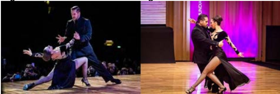
Figura 3. Mundial de Baile de Tango. Clases en la Usina del Arte

El Festival se organiza de forma tal que los aficionados que participan del Mundial de Tango puedan pasar el día entero en el predio en el que se desarrolla. Comienza al mediodía con clases y seminarios, y a lo largo del día se puede disfrutar de conciertos, conferencias, muestras permanentes y milongas abiertas. Se localizan también en el mismo predio, puestos de venta de ropa y calzado de tango preparándose para ver a los mejores en el Mundial de Tango.