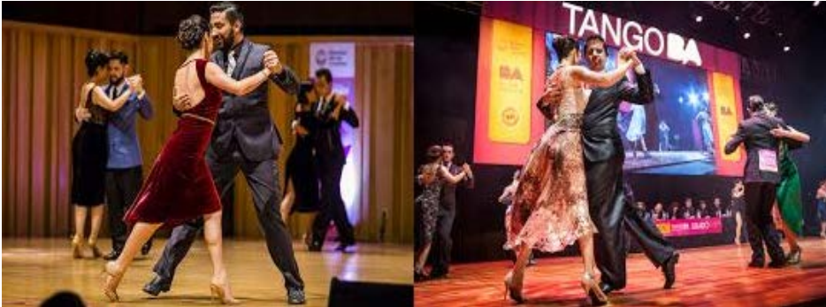
Figura 1. Final del Campeonato de baile de la ciudad en la Usina del Arte