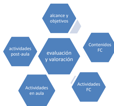
Figura 2: Áreas de actividad que conforman nuestro proyecto piloto

Aunque las referencias y fuentes de datos son prolijas, no lo es el campo de las publicaciones en experiencias concretas en los aspectos que aquí se analizan, salvo por el trabajo previo de Estelles-Miguel et al (2015) al que nuestra propuesta pretende complementar.