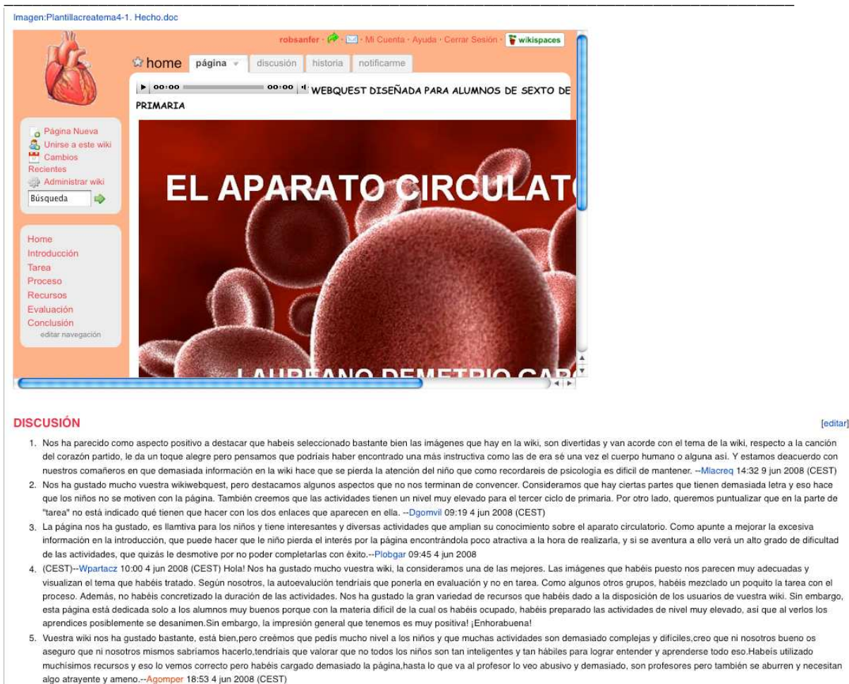
Figura 3: Crítica de los alumnos de Magisterio a las Wiki-WebQuest de sus compañeros

De esta manera, se produjo un intercambio de opiniones entre todas las partes implicadas en el proceso de creación de las Wiki-WebQuest (el profesorado responsable de la asignatura también aportó comentarios a cada uno de los estudiantes sobre el trabajo realizado), que permitió obtener unas Wiki-WebQuest adaptadas a las necesidades de los contextos educativos en las que se iban a poner en marcha.