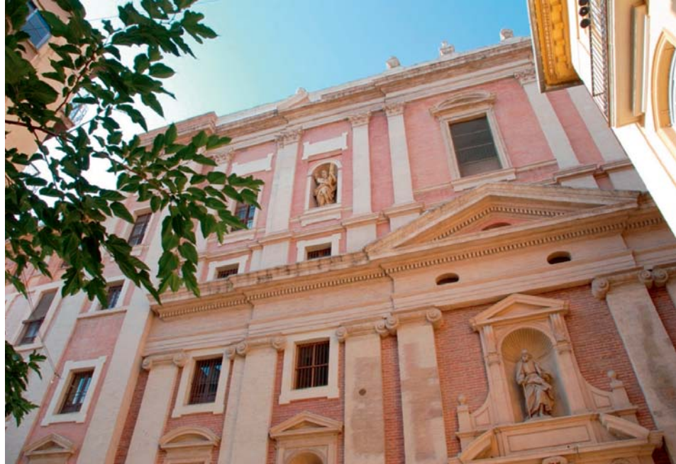
6. Church of the "Escuelas Pías". Valencia.

puede decirse que intenta consolidarla como alternativa arquitectónica, pero su postura frente al decorativismo es muy diferente. Pretende desligar la arquitectura del resto de las artes, y que pintores y escultores no ejerzan control sobre la obra arquitectónica. Por otro lado, Gilabert no busca criterios compositivos nuevos, sino que pretende recuperar el hecho arquitectónico de manera independiente al resto de las artes desde un léxico classicista completamente renovado.