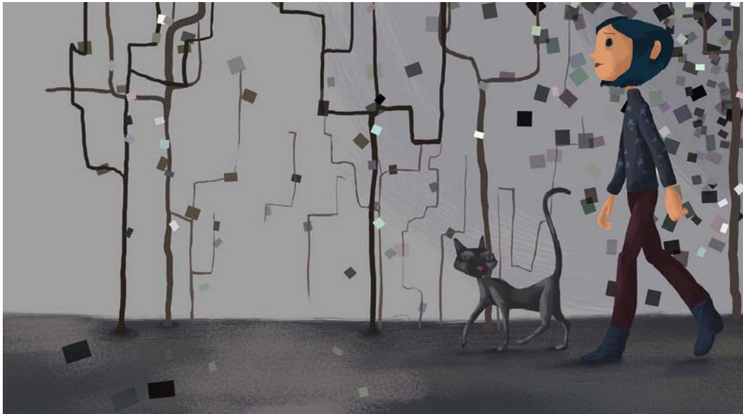
El mundo como simulación: una maléfica red tejida por la Otra madre.