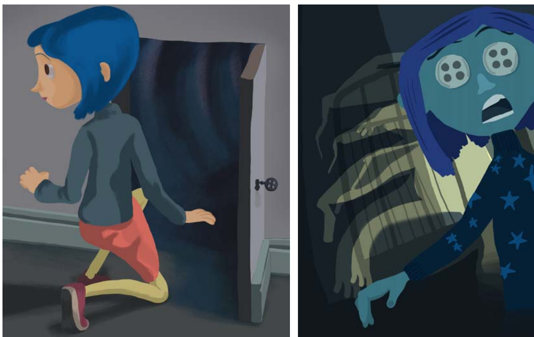
Dcha., Coraline atravesando la puerta entre ambos mundos, e izqda., imagen alegórica de la castración.