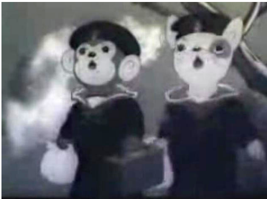
Fig. 3. Momotaro Umi no Shinpei (Mitsuse Seo, 1945). Considerado el primer largometraje de animación japonesa. Con fines propagandísticos y militares, la película fue encargada por el Ministerio de la Marina Japonesa.

proceso previo a la realización de un largometraje es coherente que primero se hayan elaborado multitud de experimentaciones y pruebas. Por eso, al igual que en otros países como Estados Unidos, Rusia, Alemania o Francia, la historia de la animación japonesa comienza a principios del siglo XX, con la creación de una serie de cortometrajes, y se reconoce 1917 como una fecha clave en la que empiezan a florecer los primeros animadores nipones, como fueron Shimokawa Oten o Seitaro Kitayama, quien filma Saru-Kani Gassen –La batalla del mono y el cangrejo– 1917, una curiosa parábola protagonizada por estos dos animales, donde ya se adelantaba la temática folclórica japonesa propia de muchos anime actuales – p.e. Dragon Ball – (Clements, Mc Carthy, 2001: 170).