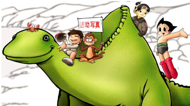
Fig. 5. Ilustración de Antonio Horno, con los personajes más famosos de los primeros anime junto con la famosa Gertie, el dinosaurio de Winsor McCay.

forja lo que se ha dado en llamar anime –que en sus manos no era sino combatir a Disney con sus propias armas: dibujo sólido, animación con acetatos, uso de la música clásica, etc.–, terminara sorprendiendo por su originalidad, hasta tal punto que las producciones de estilo anime ya no se realizan sólo en Japón, sino que esta potencia periférica ha seducido por su originalidad y aportaciones propias: prueba de ello es que los animadores que realizan series de anime en y para Occidente –tales como Código Lyoko o Ben 10 –, o cercanas a la iconografía surrealista de la mitología japonesa – como Adventure Time – son, hoy por hoy, legión.