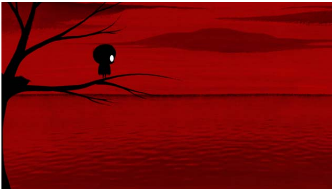
Fotograma del cortometraje.

mostrar el modo de vida de la isla pesquera, mostrando cuán dichosos eran en la familia de la pequeña Dinki, y lo feliz que es con su padre mientras van juntos por el camino que lleva a la escuela y la fábrica. Por esta vía que marcará su destino se encuentran al introvertido pájaro Birdboy, amigo de Dinki, que es incapaz de volar, a quien sólo los pájaros le animan para intentar alzar el vuelo. Todo cambia con el catastrófico accidente que transforma drásticamente el entorno y a sus habitantes: tanto Dinki como Birdboy devendrán adolescentes con problemas de conducta, intentado huir cada uno a su manera de un entorno cada vez más precario.