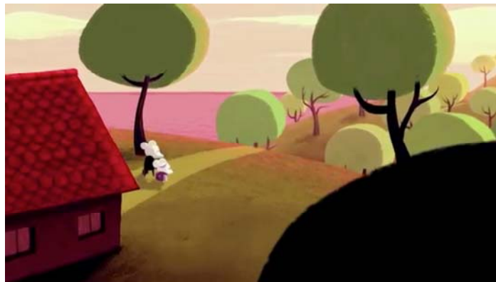
Cartel alternativo de Birdboy (izqda.), e imagen de la vida en la isla antes del accidente.

La adaptación del cómic a la pantalla nunca es fácil, y este caso tampoco lo fue: la estética minimalista del cómic y la forma del trazo de tinta posee una fuerza atrayente, que hace que nos encante su dibujo. Los integrantes del estudio barcelonés, junto a Alberto y Pedro, consiguieron definir unos diseños finales que conectan con los originales a tinta: el resultado ha sido una estética singular, útil para poder animar los personajes, haciendo un uso apropiado de colores neutros que ayudan a mantener ese ambiente desolador y agradable a la vez, jugando también con esta estética para diferenciar entre un antes y después del accidente nuclear.